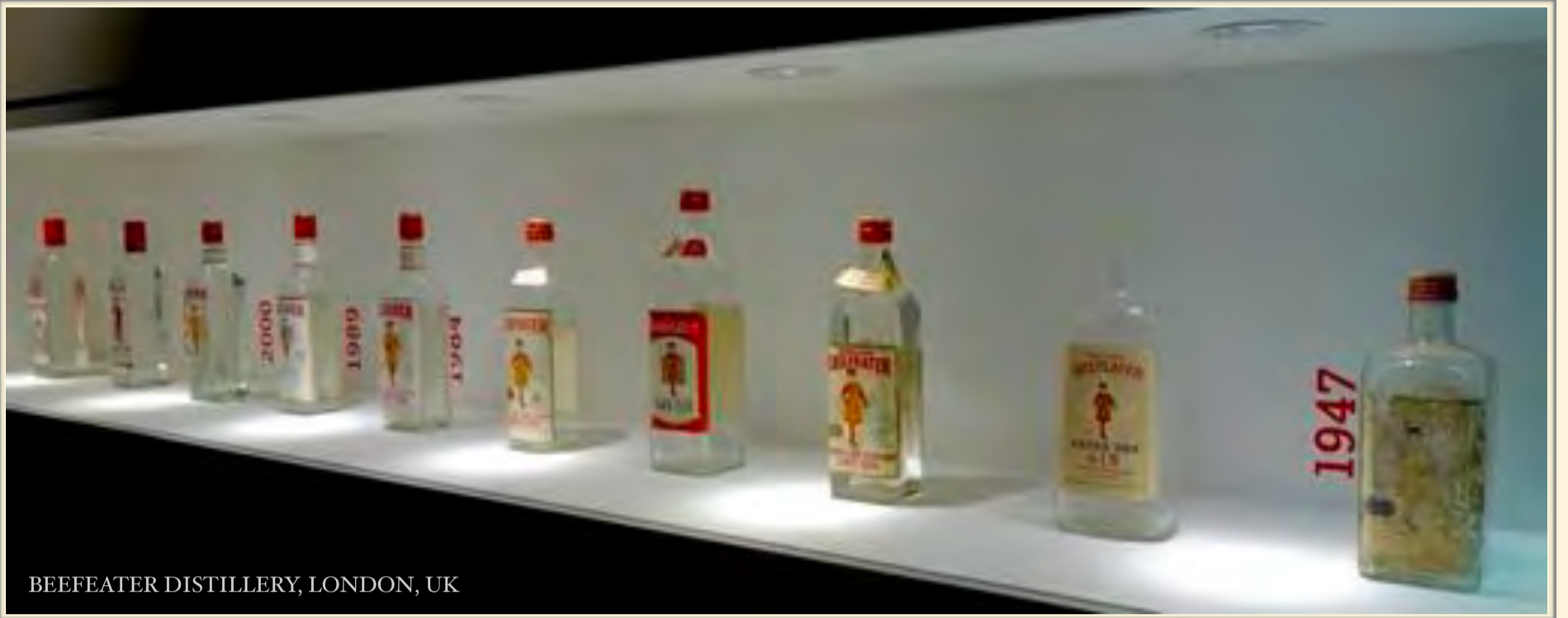
BEEFEATER DISTILLERY, LONDON, UK