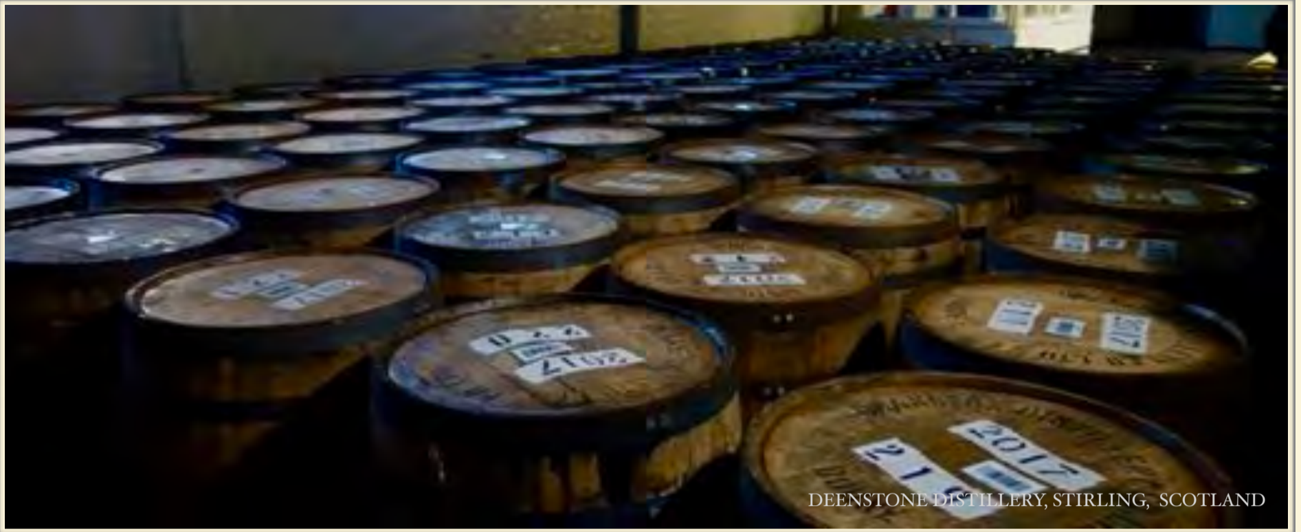
DEENSTONE DISTILLERY, STIRLING, SCOTLAND