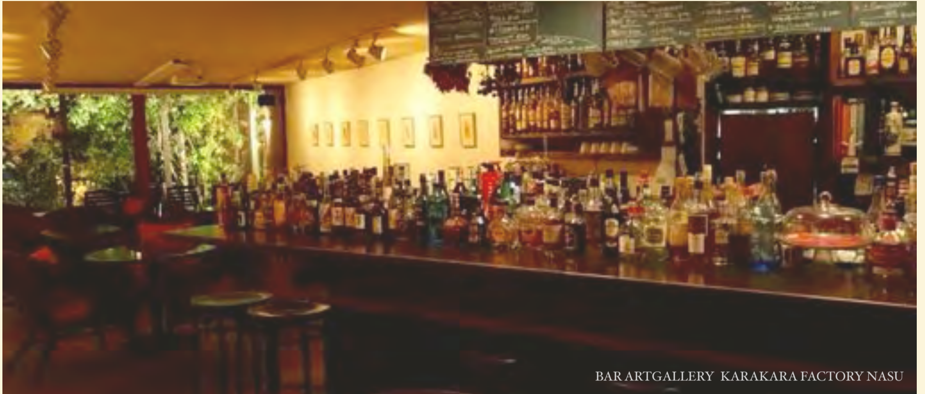
BAR ARTGALLERY KARAKARA FACTORY NASU