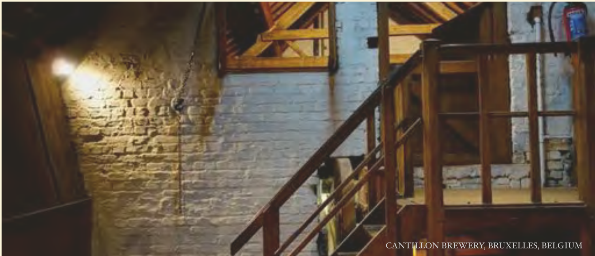
CANTILLON BREWERY, BRUXELLES, BELGIUM