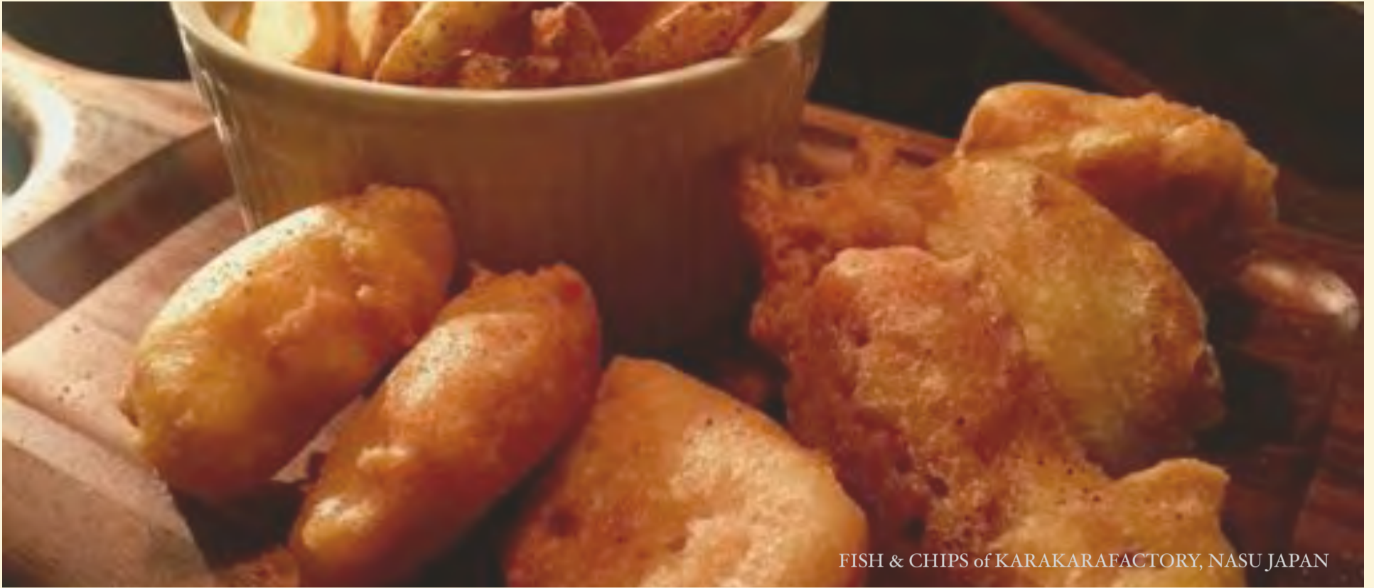
FISH & CHIPS of KARAKARAFACORY, NASU JAPAN