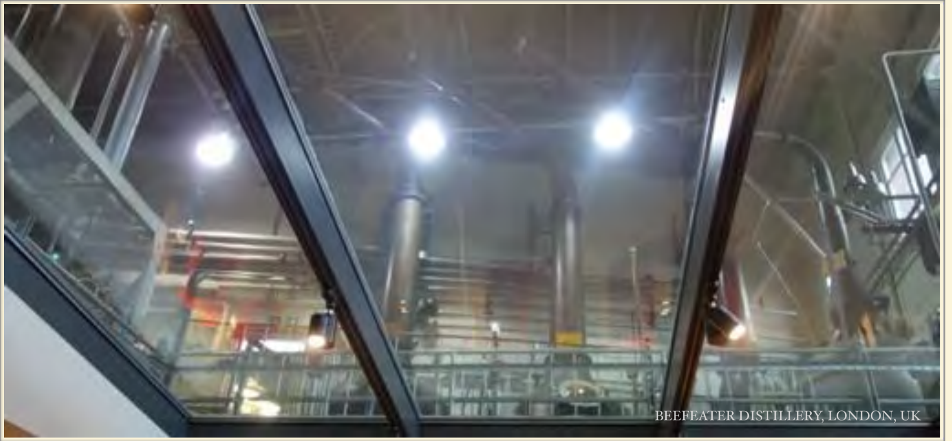
BEEFEATER DISTILLERY, LONDON, UK