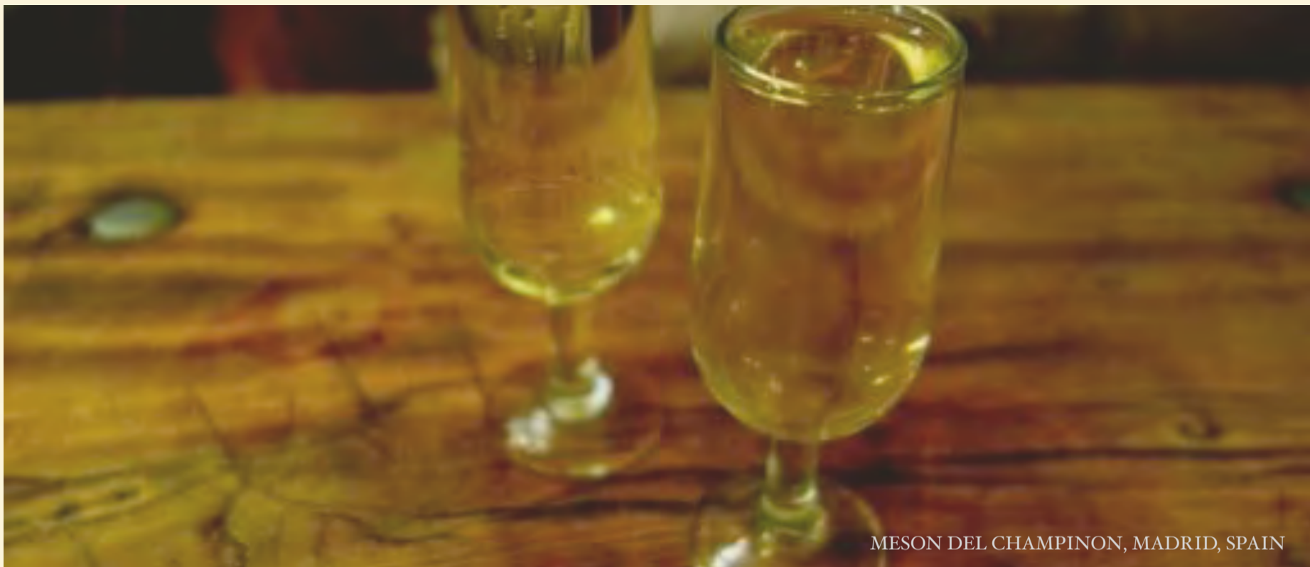
MESON DEL CHAMPINON, MADRID, SPAIN